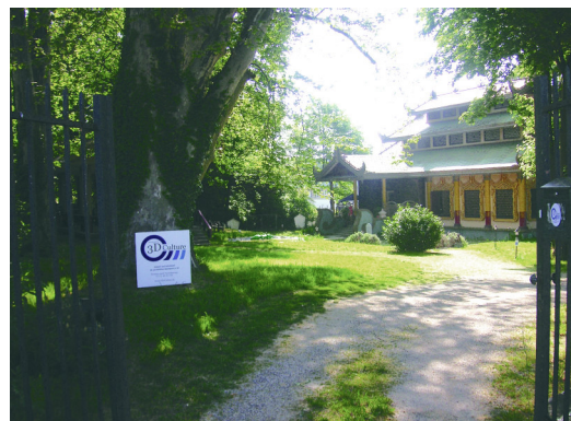
Sie sind am Ziel, herzlich willkommen.